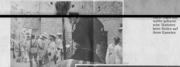
Zurück im Vergangeneinheit: Proben für den Dreh.